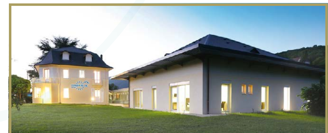
NOTRE ÉTABLISSEMENT DE CHIRURGIE ESTHÉTIQUE

Pertinence des soins, analyse du rapport bénéfice/risque sont les lignes directrices du dialogue médecin-patient afin d'apporter une information loyale. La Clinique du Lac s'engage à toute transparence vis-à-vis du patient, ainsi qu'à la bienveillance, confidentialité et l'intimité de ce dernier.